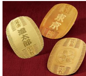
～出来上がりイメージ～